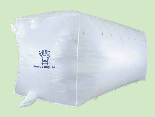
CONTAINER LINER BAG