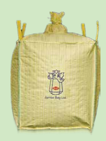
TYPE D JUMBO 🚱 STAT