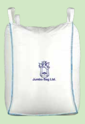
PALLET FREE BAGS JUMBO ECO PALLET