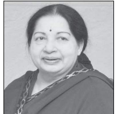
அதேபோல் கௌதம் வாசுதேவ் மேனன் ஜெயலலிதாவின் வாழ்க்கை வரலாற்றை இணையதளத்தொடரகத்தயாரிக்க இருப்பதாகவும் அதில் நடிக்க