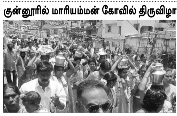
குன்னூரில் மாரியம்மன் கோவில் திருவிழா