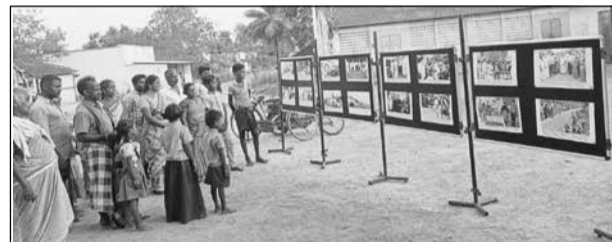
விருப்பூர் மாவட்டம், வல்லம் ஊராட்சி ஒன்றியம், நீர்ப்பெருந்தகை ஊராட்சியில் செய்தி மக்கள் தொடர்புத் துறை சார்பில் பதவிக்கு விருப்பம் மனுவினை சாதனை விளக்க புகைப்படக் கண்காட்சியினை பொதுமக்கள் பார்வையிட்டனர்.