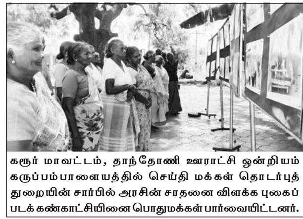
கருர் மாவட்டம், தாந்தோணி ஊராட்சி ஒன்றியம் கருப்பம்பாளையத்தில் செய்தி மக்கள் தொடர்புத் துறையின் சார்பில் அரசின் சாதனை விளக்க புகைப்படக் கண்காட்சியினை பொதுமக்கள் பார்வையிட்டனர்.