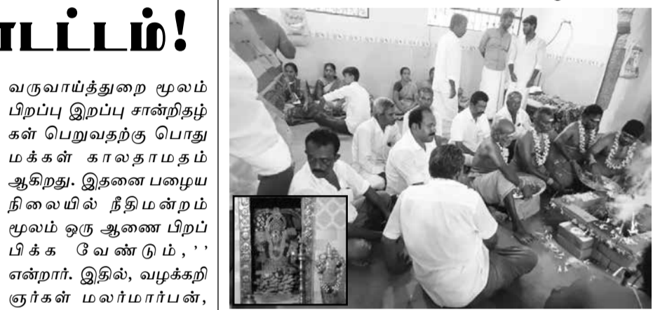
நெல்லை, ஏப். 27- நெல்லை பாளை அருகே அரியகுளம் சுந்தரவல்லி அம்பாள் கோவில் கொடை விழா, 108 திருவிளக்கு பூஜையுடன் நடந்தது. பாளையங்கோட்டை தாலுகா அரியகுளம் சுந்தரவல்லி அம்பாள் கோவில் கொடை விழா கடந்த சனிக்கிழமை கலிவரத சால்தா கோவில் கொடையுடன் துவங்கியது. தொடர்ந்து ஞாயிறு அன்று, காணியாளப் பெருமாள் கோவில் சிறப்பு பூஜை நடந்தது. 25ம் தேதி திங்கட்கிழமை, இரவு சுந்தரவல்லி அம்பாளுக்கு மாக்காப்பிட்டு தீபாராதனையுடன் 108 திருவிளக்கு பூஜையும் நடந்தது. 26ம் தேதி காலை 7:00 மணிக்கு வரதவிநாயகர் கோவிலில் இருந்து பால் குடம் வலம் வந்தது. காலை 11:00 மணிக்கு கணபதி ஹோமம் மற்றும் தீபாராதனைகள் நடந்தது.