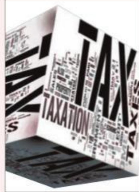
off ₹1.45 lakh crore as the government slashed corporate tax rates up to 10 percentage

points, the biggest reduction in 28 years.