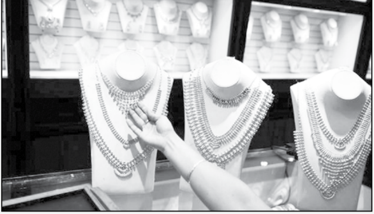
ஆயிரத்தைத் தங்கத்தின் விலை சவரனுக்கு 112 ரூபாய் அதிகரித்து, 31 ஆயிரத்து, எட்டு ரூபாய்க்கு விற்பனையாகிறது. அதே போல், ஒரு கிராம், 14 ரூபாய் அதிகரித்து, 3,876 ரூபாய்க்கு விற்பனை செய்யப்படுகிறது. வெள்ளி விலையும் கிராமுக்கு 30

சென்னையில் ஆயிரத்தைத் தாண்டிய விலை அதிகரித்து சவரன் மீண்டும் 31 ஆயிரம் ரூபாயை கடந்துள்ளது. கடந்த ஆண்டில் விற்பனை வெண உயர்ந்த தங்கம் விலை நடப்பாண்டு தொடங்கிய சில நாட்களிலேயே, 31 ஆயிரம் ரூபாயை கடந்து புதிய உச்சத்தை எட்டியது. அதன் பின்னர் சற்றே குறைந்த தங்கம் விலையில் கடந்த சில நாட்களாக ஏற்ற இறக்கம் நிலவி வந்தது. இந்த நிலையில், இன்று [27ம் தேதி] மீண்டும் ஆயிரத்தைத் தாண்டிய விலை 31 ஆயிரம் ரூபாயை கடந்துள்ளது. அந்த வகையில் சென்னையில் இன்று [27ம் தேதி]