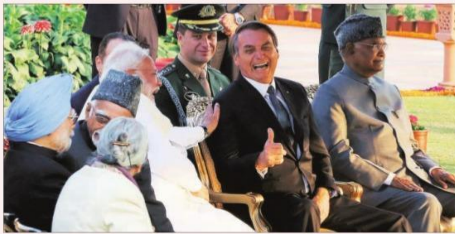
(From right) President Ram Nath Kovind, Brazil President Jair Bolsonaro, Prime Minister Narendra Modi, former vice-president Hamid Ansari and former PM Manmohan Singh during the 'At Home' ceremony in the Rashtrapati Bhavan on Sunday

"We have saved about ₹16,000 crore on the land acquisition front alone as land could be acquired at a cost of ₹80 lakh per hectare for the project," he said, adding that the expressway will unlock new economic opportunities in hinterland districts of Haryana, Rajasthan, Madhya Pradesh and Gujarat.