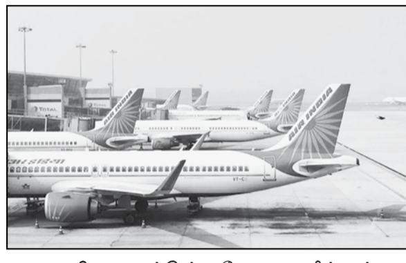
துறை நிறுவனத்தில் பணியாற்றும் ஊழியர்கள் என அனைவரும் எதிர்ப்பு தெரிவித்து வருகின்றனர். இந்த நிலையில், ஏர்-இந்தியா நிறுவனம் சுமார் ரூ.80 ஆயிரம் கோடி கடனில் உள்ளது. இதனால் இதை தனியார் மயமாக்க மத்திய அரசு முடிவு செய்துள்ளது. அதன்படி, ஏர்-இந்தியாவின் இணைப்பு நிறுவனமான ஏ.ஐ.எக்ஸ். எல்., மற்றும் ஏ.ஐ.எல். ஏ.டி.எல்., சின் 50 சதவீதம் பங்குகளையும் விற்க முடிவு செய்யப்பட்டுள்ளது.

புதுடில்லி, ஜன. 27- ஏர்-இந்தியாவின், 100 சதவீத பங்குகளும் தனியாருக்கு விற்கப்படுவதாக மத்திய அரசு அறிவிப்பு வெளியிட்டுள்ளது. மத்திய அரசின் கீழ் இயங்கும் பொதுத்துறை நிறுவனங்கள் பெரும்பாலும், நஷ்டத்தில் இயங்குவதால், அந்த நிறுவனத்தின் பங்குகளை தனியாரிடம் விற்க மத்திய அரசு தொடர்ந்து தீவிர முயற்சிகளை மேற்கொண்டு வருகிறது. இதற்கு பல்வேறு மாநில அரசுகள் மற்றும் பொதுத்