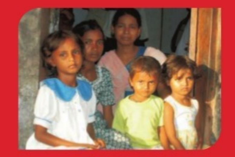
MUMBAI BLAST VICTIMS RELIEF FUND All the money collected under this scheme has been used to open an FD account in the name of the five children of the Yadav family, who lost their parents in the Mumbai blast at the Gateway of India in 2003. They will have access to these funds when they turn adults.

utility block in a Government School in village Lagma, district Saharsa. Inaugurated in May 2011, The Express Block functions as a school-cum-flood relief centre for villagers.