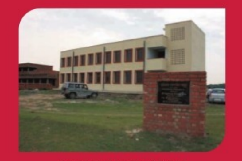
BIHAR FLOOD RELIEF FUND The funds have been used to build a multi-

PUNE WAR MEMORIAL Inaugurated in 1998, this memorial was